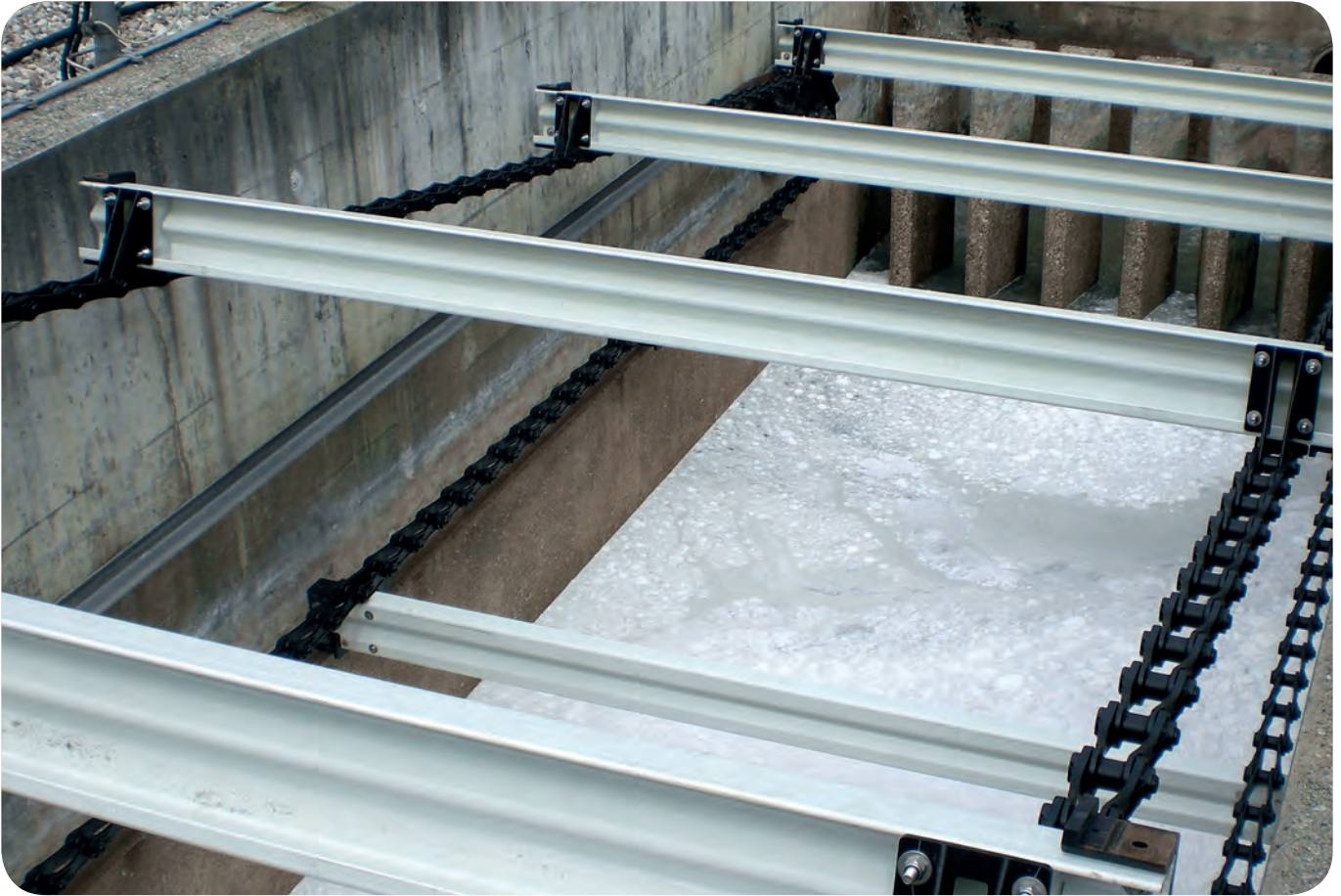
Oberflächenräumer für Industrieanwendungen